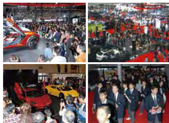
前回(第20回名古屋モーターショー)の様子