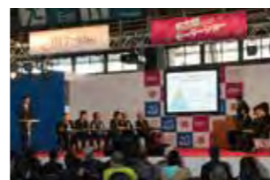
「大学生による研究発表の様子」